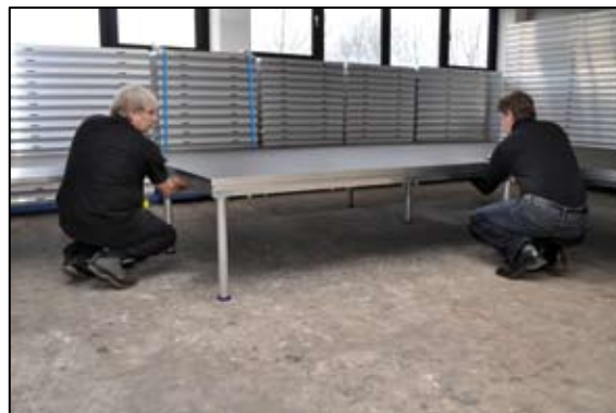
Lås de 2 sikringer (de blå klik-klak under podiet)