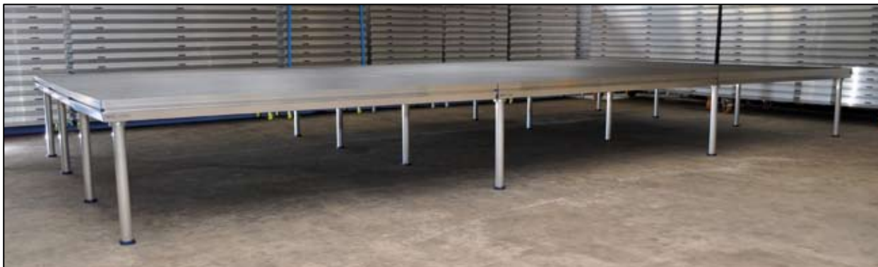
9 podier = 16 ben Når I tager scenen ned igen, så starter I med det sidste podie I satte op.