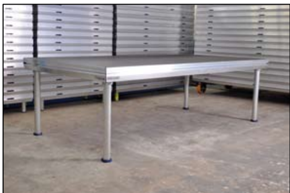
1 podie: 4 ben. Hansiderne skal være bagpå og på højre side

Start altid i øverste højre hjørne - længst væk fra publikum