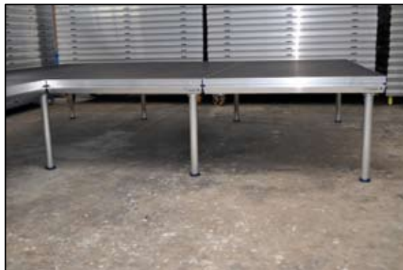
Højre side: 3 m = 3 podier = 8 ben