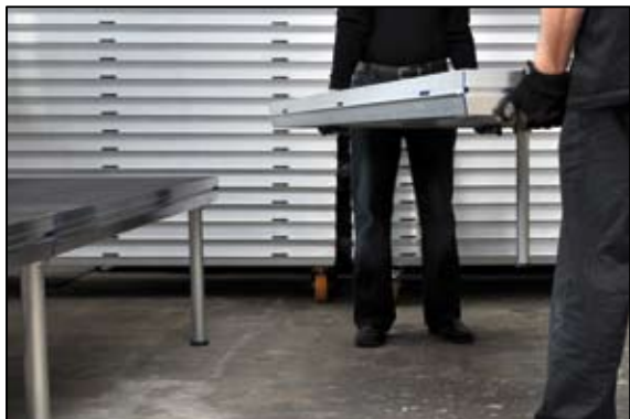
Alle andre podier i højre side: 2 ben

Sådan sættes den yderste række til højre op (set fra publikum)