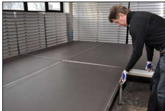
Sæt hjørnerne af hunsiderne på hunsiderne, så der stadig er hul i midten.