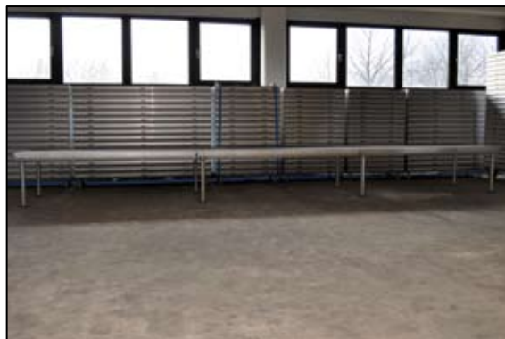
Bagerste række: 6 m = 3 podier = 8 ben

Sådan sættes den yderste række til højre op (set fra publikum)