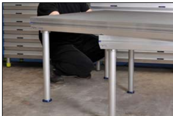
Alle andre podier i bagerste række: 2 ben