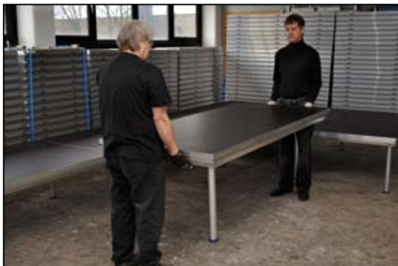
Alle andre podier skal kun have 1 ben